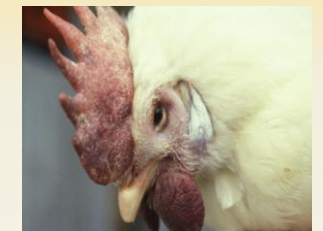
Las aves afectadas por la HPAI pueden presentar inflamación de la cabeza, crestas, mocos de pavo y rostro.