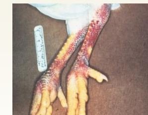
La hemorragia de la piel y piernas es solo uno de los signos que las aves pueden presentar cuando están infectadas con el virus HPAI.