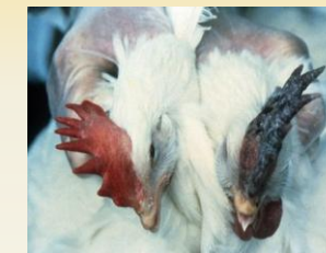
La descoloración purpura de la cresta podría indicar HPAI.