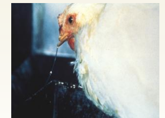
La descarga nasal (goteo nasal) puede ser un signo de HPAI.