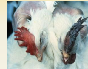
鸡冠的紫色的变色可能表明高致病性禽流感(HPAI)病毒。